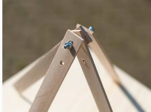
Verbindingen kunnen ook ruimtelijk gemaakt worden