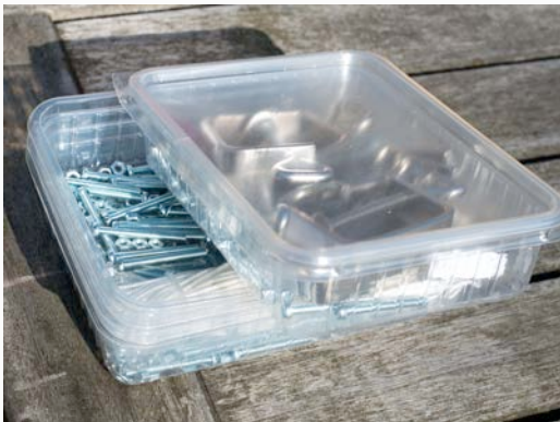
Opruimen: 3 of 4 bakjes in elkaar, de bovenste krijgt de tafelklemmen erbij in, en een deksel erop.