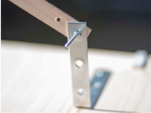
Aan de metalen hoek wordt de uitkraging verankerd