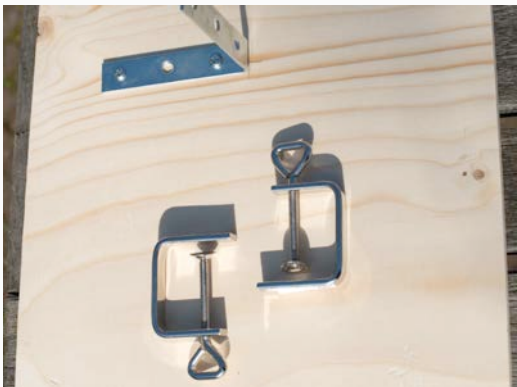
Elk groepje krijgt 2 tafelklemmen waarmee de plank.....