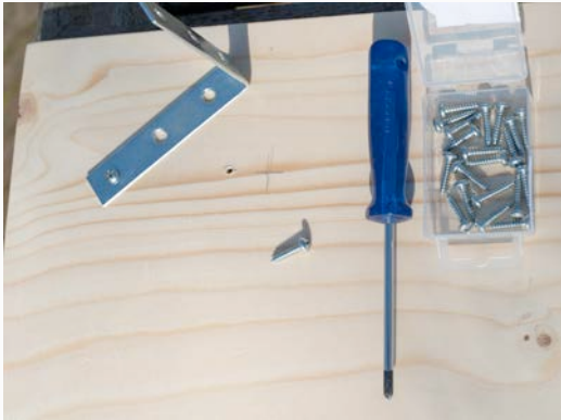
Vorbereitung: Metalen hoek vastzetten met parker