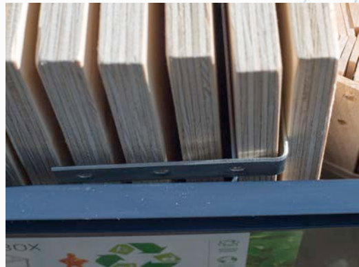
Inpakken: de buitenste planken met de metalen hoek naar binnen gericht.