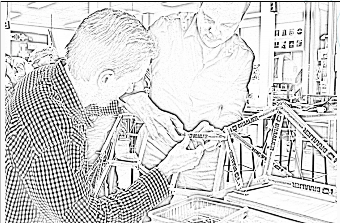
Constructeurs bouwen tijdens de eerste instructiedag 4 maart 2014